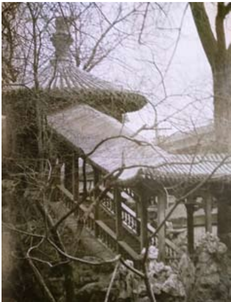
溥贝勒府因爬山游廊

第二，归还郑亲王府。郑亲王府位于西城大木仓。郑亲王济尔哈朗的七世孙端华亦为清室重臣。道光、咸丰两帝去世后，曾两授顾命，手握大权，与慈禧太后发生尖锐矛盾。咸丰十一年（1861）慈禧太后发动“辛酉政变”，令端华自尽，革去亲王爵，郑王府也被内务府收回。同治三年，恰值奕詝分府，即将郑王府分给钟郡王奕詝，郑王府遂改作钟王府。不久，清廷又“复还郑亲王爵”，由端华的族侄承志承袭。但不久，承志因案革爵。所以，在承志袭郑亲王爵时，郑王府并没有归还，仍由钟王奕詝居住。同治七年（1868），钟王奕詝死，无子，由恭亲王奕訢之次子载澂过继为嗣，袭贝勒爵，仍住钟王府，即原郑王府。同治十年八月，清廷又改由端华的族弟庆至袭郑亲王爵。并于同年十二月降旨命载澂迁出，将原郑王府归还郑亲王庆至。