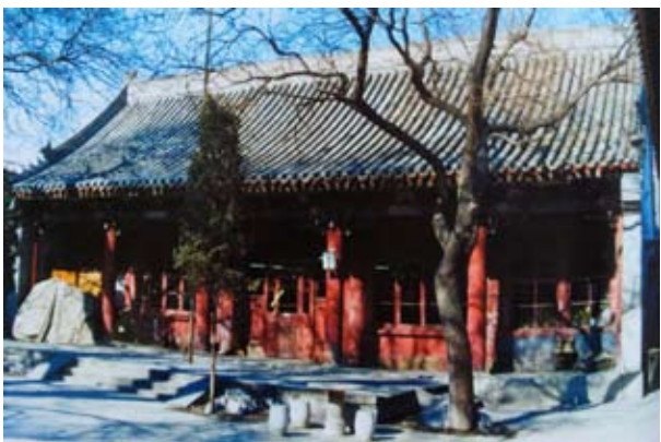
《清史图典·康熙朝》中愉郡王府第，现为北京市第十三中学

《北京市志稿》记载：“迨民国十五年成立大学，更名辅仁大学，预科附焉。至民国十八年六月，遵照教育部令，停止预科，改办高中，采用三三学制，添设初中，以期培植大学良好基础。”可见，辅仁附