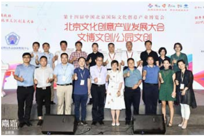
北京文化创意产业发展大会文博文创、公园文创分论坛合影

对北京文博、公园系统进行调研,以期进一步了解北京市公园、文博系统在文创开发中遇到的问题,并研究出未来的文化对应策略。论坛上,中国传媒大学文化产业管理学院硕士生导师杨剑飞老师“剧透”了这份初步调研报告,引得现场文博人对调研报告的最终出炉万分期待。他结合国内外如故宫、颐和园、大英博物馆、纽约大都会博物馆等在文博文物产品开发上取得成功的知名文博单位文创开发经验,提出要在“求新勿忘复古,求变勿忘传统”的基础上,从资源开发理念、运营模式、应用技术及人才培养制度四个方面加大创新力度。