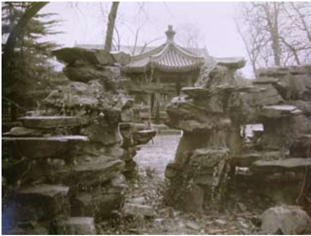
溥贝勒府园青石假山

第三，愉郡王府改作钟王府。同治十年十二月，贝勒载澂奉旨将郑王府归还郑亲王庆至后，迁居原愉郡王府，自此历经康熙、雍正、乾隆、嘉庆、道光、咸丰、同治七朝共 160 多年的愉郡王府改作了钟王府。