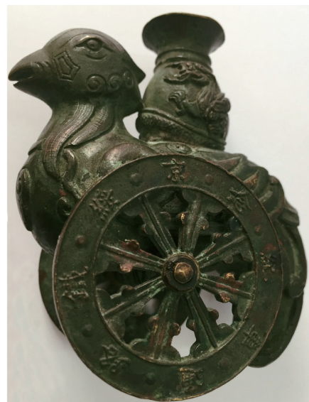
詹天佑纪念馆中陈列的“天鸡车尊”

时北京铁路分局将其拨交铁道部科学技术馆（中国铁道博物馆前身），又于1987年拨交新成立的詹天佑纪念馆馆藏至今，该文物于2013年被认定为国家一级珍贵文物。至于说是詹天佑先生保存的，这一说法显然与史实相左，詹天佑先生逝于1919年4月24日，该文物车轮一侧所铸阳文显示时间是1921年7月1日，而据曾担任过京绥铁路总工程师的陈荫东在京绥铁路通车典礼的演讲词可知，京绥铁路通车典礼的举办时间是1921年9月19日，也就是说詹天佑先生在京绥铁路通车时已