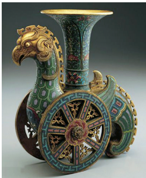
台北故宫博物院藏“清拍丝珠琅天鸡尊”