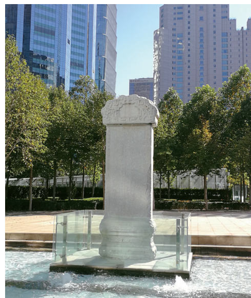
乾隆御题“金台夕照”石碑

乾隆首先想到了这卷画。史树青先生对此画有过这样的描述：“王绂此图，绘山水平台在夕照中，并不是建筑遗址形状，可知金元人所传的金台，全是后人所附会。”乾隆当然也看出了后人附会的成分，那为何依旧为“金台夕照”题诗树碑呢？根据他的题诗，我们发现他关注的并非景致本身，而是“好贤”“存古”“流风”这三个概念，换言之，这才是乾隆眼中的“金台夕照”。