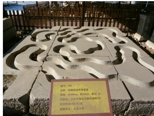
北京大学捐赠给圆明园的流杯石

北京大学捐赠给圆明园的流杯石应是治贝子园的。治贝子园流杯石长366厘米、宽320厘米、厚32厘米。由九块大小不同的灰白色大理石拼成。石渠图案为对称形，中心为如意云头，左右各两个对称折弯包围云头。治贝子园原在今北京大学五四运动场北侧，园子的主人是清代道光皇帝之孙载治。光绪末年落人载治第五子溥侗之手，所以又称侗五爷园。金勋先生著《成府村志》称其为苏大人园，治贝子园原来是清嘉道时期工部尚书苏楞额的宅园。治贝子园，在成府南头，大门正对海淀镇。两进院落。一进院正房面阔五间，三卷式共十五间。正房前为牡丹花坛。二进院正房五间，三卷式十五间。院落北侧是花木果园和叠石假山。院落西侧有一个人工湖池，池北岸用云片石就土山叠成一座高台，台上建龙王庙三间。池之东岸为果园，池南为流杯亭。流杯亭北向为厦，面阔三间，远望如戏台。抱厦内地面用大理石铺就地面，地面凿成宽和深约为八寸的回环弯曲的云形石沟，