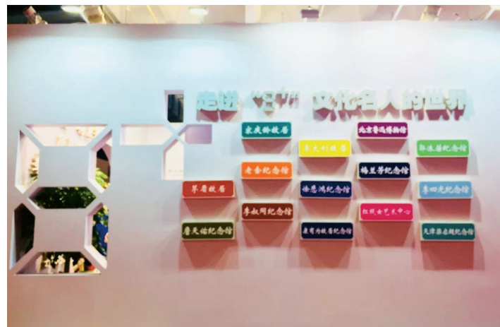
“8+”名人故居博物馆联合展区

郭沫若纪念馆等八家名人故居博物馆联合参展，通过传播历史文化名人其人其事，弘扬社会主义核心价值观，引导公众选择正确的主流价值观。