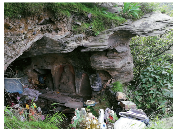
戒台寺佛教石窟现状

左龛呈拱形，上窄下宽，高86厘米，底部最宽处63厘米，进深36厘米，龛内原摆放佛像已不存。龛内残留朱砂色。右龛凿刻呈方形，内堆满杂物，高90厘米，宽90厘米，进深90厘米，龛内残存一尊无头佛造像，汉白玉质，通过观察佛像背部残状，可知其应是从岩体上整体切下，残高63厘米，宽60厘米，外着双肩袈裟袒胸，衣纹线条雕刻细腻工整。腰间系蝴蝶结状丝带，右手残毁，左手稍残平伸，抚于小腹，结跏趺端坐于莲花宝座之上。莲花座为二层仰莲花座，长70厘米，龛内佛像周围留有朱砂色。龛左侧下方竖刻“天台叶忠题”五个楷体字（叶忠为明朝太监）。字长7厘米，宽6厘米，刻字面高38厘米。