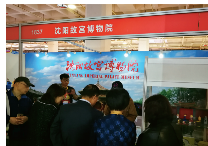
沈阳故宫博物院展区颇受欢迎

4. 非国有博物馆发挥机制优势，文创亮点突出北京百年世界老电话博物馆、古陶文明博物馆、纪晓岚故居、关帝庙四家非国有博物馆共同参展，展示社会力量对文物保护和文化价值挖掘中起到的重要作用，亮点突出。