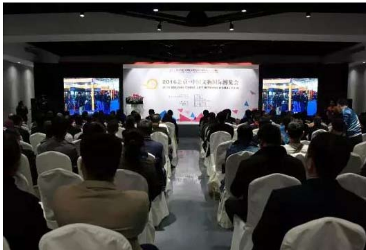
2016北京·中国文物国际博览会在保利会展中心开幕