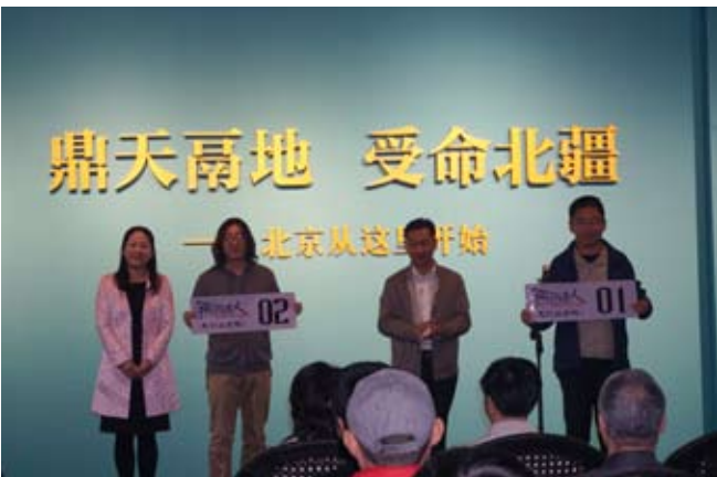
向参与“燕国达人自驾游”活动的车主赠送车贴

2016年10月15日，首届“燕国达人自驾游”启程了，第一站我们来到了位于河北易县的清西陵，参观了两个比较有代表性的帝王陵墓崇陵和泰陵。崇陵是光绪皇帝的陵墓，虽然陵墓的建筑质量以及规模不及前朝皇帝，但是崇陵是清西陵中唯一打开地宫的帝陵。泰陵是雍正皇帝的陵墓，由于当时正处在清朝国力的上升期，所以泰陵的建